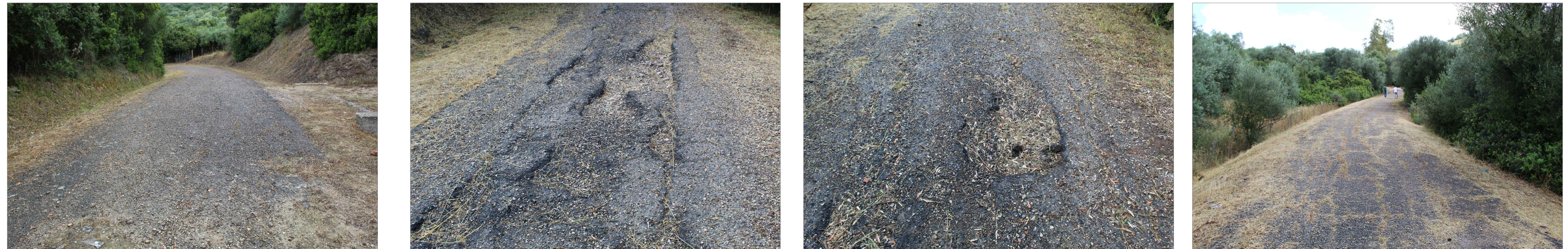
FOTO STATO DI FATTO _ MANTO STRADALE

Vico Il A. Sais n. 5 - Masullas (OR) - Via della Pineta 150 / Via Satta 44/A Cagliari (CA) - Banchina dell'Azoto 15/D Venezia (VE) tel. + 39 3405453623 ; + 39 3397791248 e-mail: ing.vaccaaleccio@gmail.com; jari@ajfdesign.it