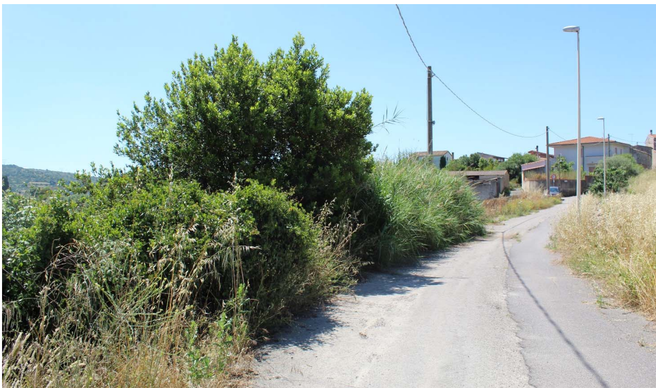
Via Angioi – Forte vegetazione e avvallamento della parte bassa