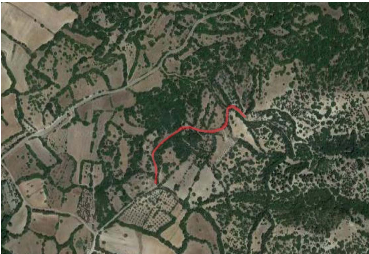
Ortofoto – Strada Vicinale de Sa Murta