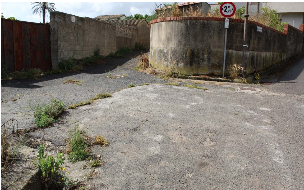
Via Angioi angolo Vico Angioi