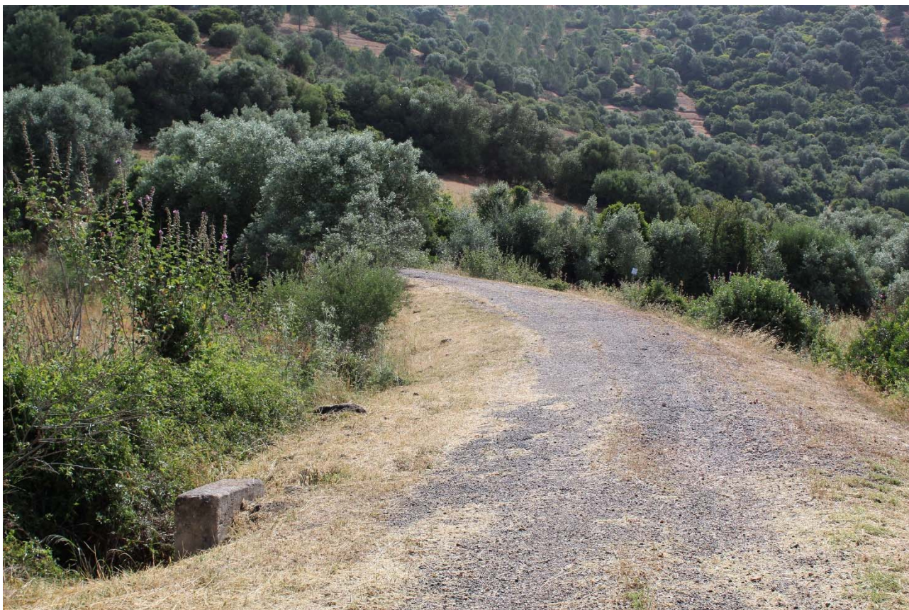
Strada vicinale de Sa Murta – dilavamento del tratto superficiale

Nella strada rurale sita in località Pardu Eguas a causa di cedimento longitudinale causando l'affioramento di un pozzetto che rende pericoloso il precorrimento del tracciato stradale.