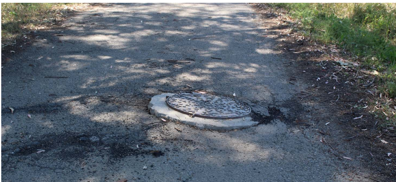
Pozzetto Loc. Pardu Eguas

Nella strada rurale sita in località Pardu Eguas a causa di cedimento longitudinale causando l'affioramento di un pozzetto che rende pericoloso il precorrimento del tracciato stradale.