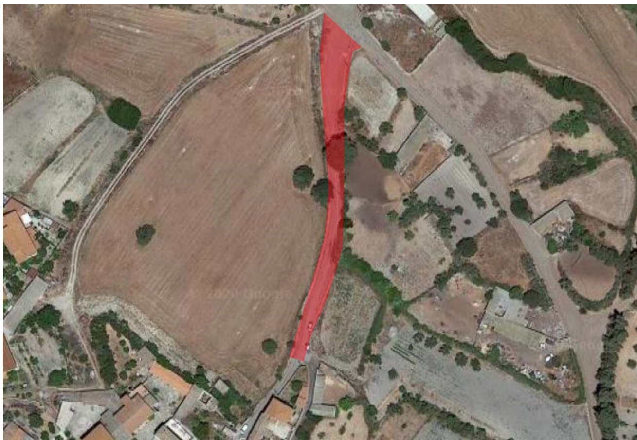
Ortofoto - Via Angioi

La via Angioi si estende dal centro urbano verso la parte di agro n direzione est, ed il tratto oggetto di intervento è quello compreso tra l'intersezione con il vico Angioi sino ad arrivare all'intersezione con la Via San'Elena.