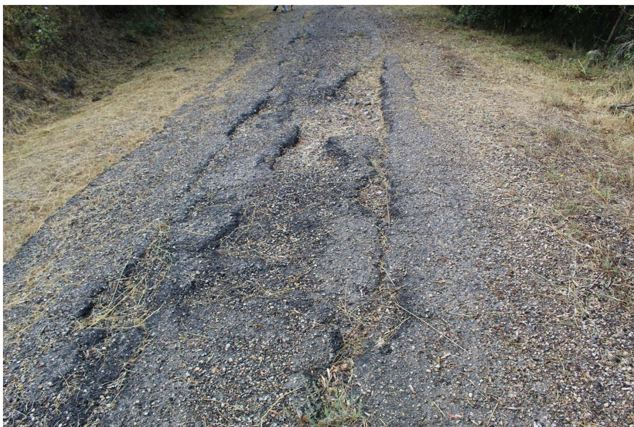
Strada vicinale de Sa Murta – fessurazioni e dissestamenti